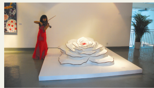
唐勇《花——生命的欲望2》