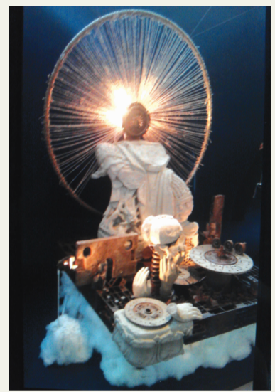
周晓波《哈姆莱特——悲悯2012》