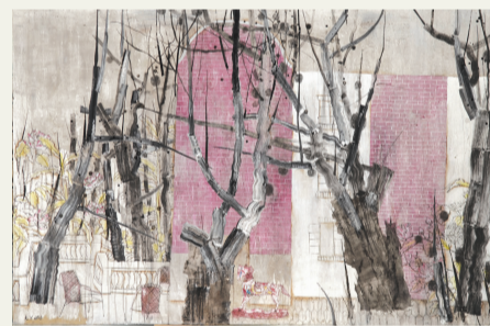
康益《掠过记忆的涟漪》