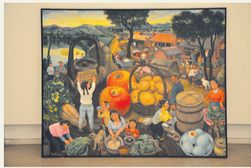
陈树中《野草滩,端午粽香》