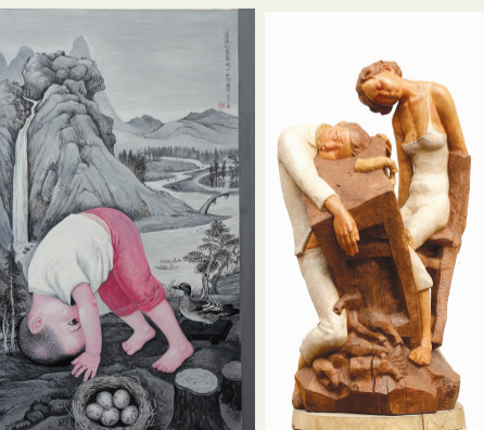
田欣《遥远的家园之二》 龚吉伟《一醉方休2》